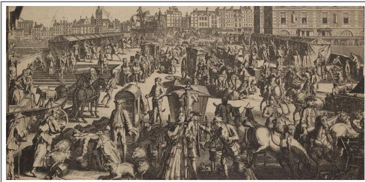
L'Embaras de Paris - Nicolas Guerard