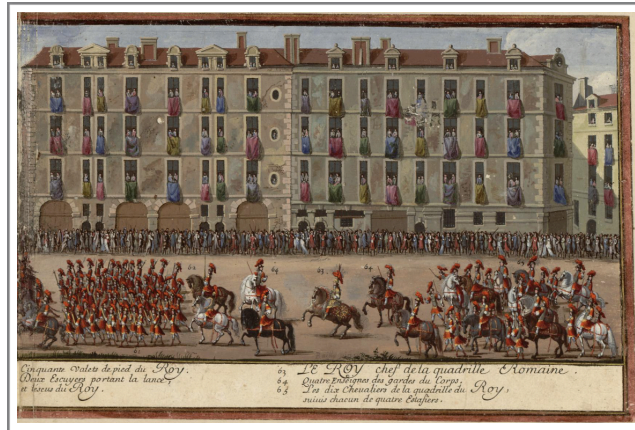
Détail : Courses de testes et de bague, faites par le Roy et par les princes et seigneurs de sa cour en l'année 1662 Perrault Charles 1628-1703