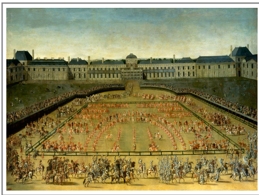
Le Grand Carrousel donné par Louis XIV dans la cour des Tuileries à Paris, pour célébrer la naissance du dauphin- Henri de Gissey.