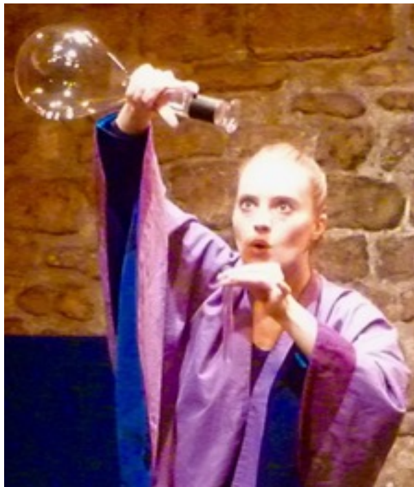
The Ballad of Wolf Rock - La Roche du Loup - Gala Besson

(Ces périodes sont modulables et peuvent être répétées)